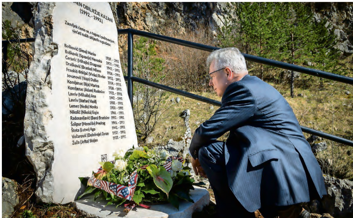
Američki ambasador na Kazanima: Mušan Topalović Caco je naredio ubistva