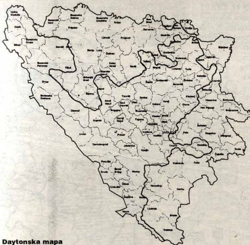
■ Daytonska mapa

KRAJ BOSNE ILI RUŠENJE VELIKE SRBIJE: Srbijanski predsjednik Slobodan Milošević bio je mnogo otvoreniji i rekao je da je pitanje bosanske Posavine znatno ranije dogovorio s Tuđmanom. Iako je predsjednik Izetbegović u Sarajevu rekao da je daytonski sporazum označio kraj velikosrpskog projekta, mnogo je više u svijetu onih koji tvrde da je u Daytonu odigrana predstava koja je označila kraj multietničke Bosne. Ozbiljni analitičari u svijetu smatraju da je za održanje jedinstvene i ekonomski integrirane Bosne potrebno dugotrajno međunarodno prisustvo, znatno