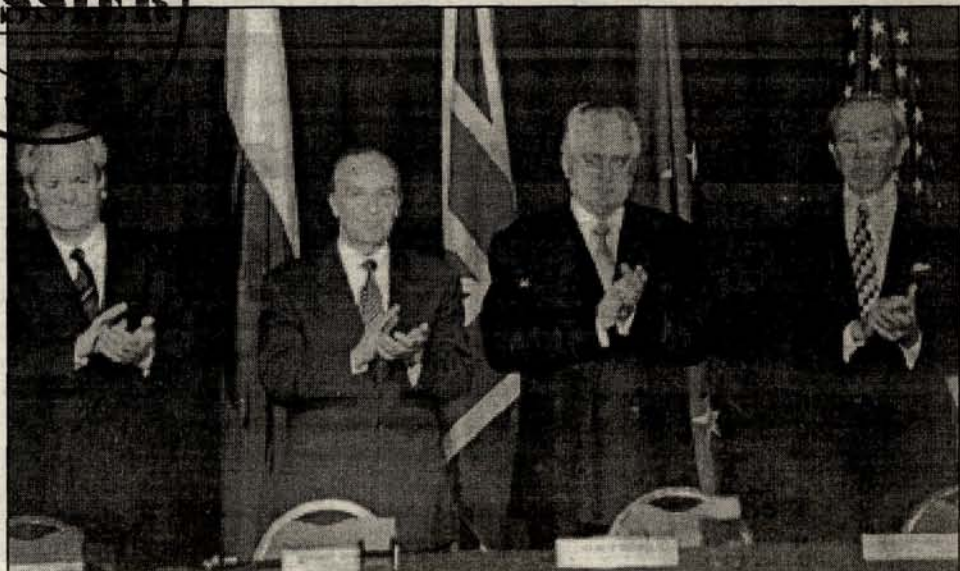
■ Čemu ko aplaudira