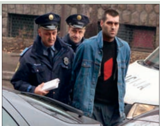
Privođenje osumnjičenoga u Tužilaštvo