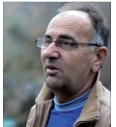
Muminović: Nekad se spavalo u mlinovima