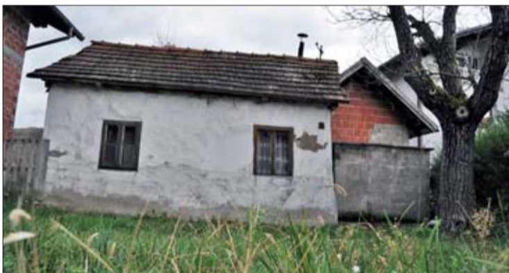
Kuće na stijenama