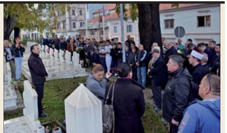
Pomen stradalima na Šehitlucima

- Tokom rata nismo mislili o pravima, već o našim domovima i našoj djeci koju smo branili svih tih godina. Nažalost, već neko vrijeme pojedinci su aktivni na polju umanjivanja naših prava. Mi imamo svojih prava na nivou države, entiteta i kantona, u zakonima i papirima koliko god hoćete. Među-